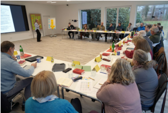
Regionentreffen im Januar 2026

In diesen Treffen ging es insbesondere darum, einander besser kennenzulernen, die Besonderheiten der einzelnen Kirchengemeinden festzustellen und miteinander ins Gespräch zu kommen.