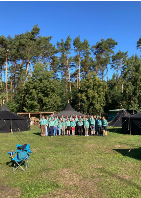
Alle Bilder: Sommerlager 2025.

Auch 2025 haben wir in den verschiedenen Gruppenstunden viele tolle Aktivitäten unternommen. Immer wieder gerne wird von den Kindern das Feuer machen geübt, und natürlich kann man über so einem Feuer auch tolle Pfannkuchen oder Stockbrot selber machen. Aber auch das Lesen und Kennenlernen von Bibelgeschichten zum Anfang einer Gruppenstunde kam nicht zu kurz, ebenso wie das Singen verschiedener Lieder. Hierbei merken wir, dass das Singen den Kindern und der Gemeinschaft guttut, da sich hier